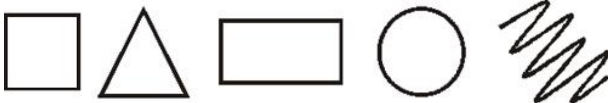
Рис. 2. Психометрический тест

Если Вы испытываете сильное затруднение, выберите из фигур ту, которая первой привлекла Вас, нравится больше остальных. Запишите под ее изображением цифру 1. Теперь проранжируйте оставшиеся четыре фигуры в порядке вашего предпочтения и запишите цифры под ними.