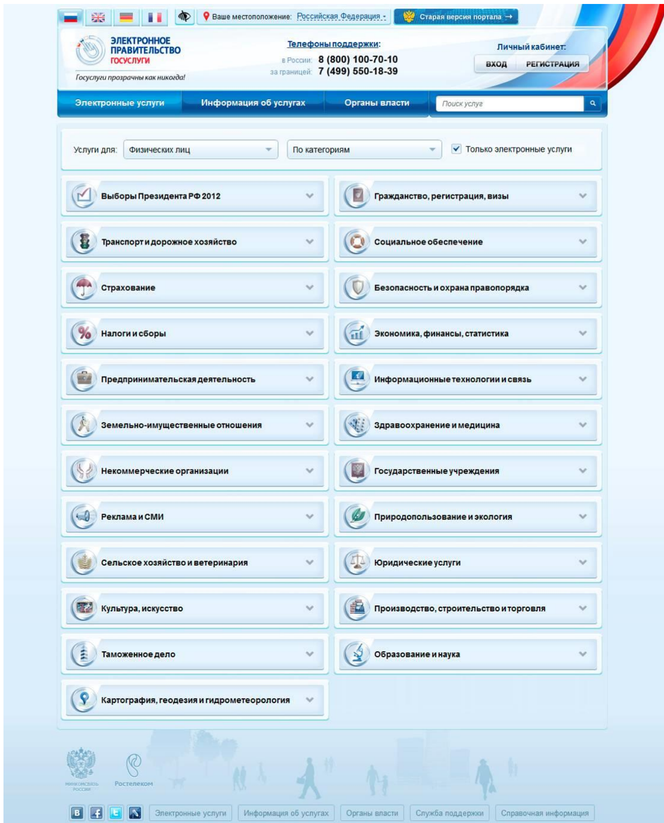
Рис. 1. Электронные государственные услуги по категориям