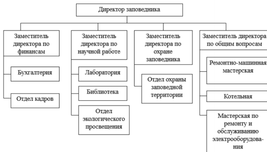
Рисунок 1. Организационная структура ФГУ «Государственный природный заповедник «Северная звезда»

Деятельность ФГУ «Государственный природный заповедник «Северная звезда» осуществляется на основе сметного финансирования из федерального государственного бюджета. Организационная структура представлена на рисунке 1.