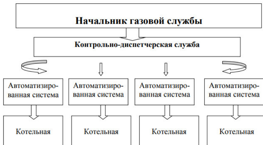
Рисунок 2 – Обслуживание котельных САУ

Предприятие планирует перевод котельных на системы автоматизированного управления (САУ), которые осуществляют автоматический контроль работы оборудования котельных и не требуют постоянного присутствия рабочих в котельной. Схема обслуживания котельных с САУ изображена на рисунке 2. Система управления работой котельных принципиально изменится. Появляется возможность вместо штата работников каждой отдельной котельной организовать один пункт контрольно-диспетчерской службы, осуществляющий дистанционный контроль текущей работы котельной. Следовательно, можно существенно сократить численность работников, занятых обслуживанием работы котельных.