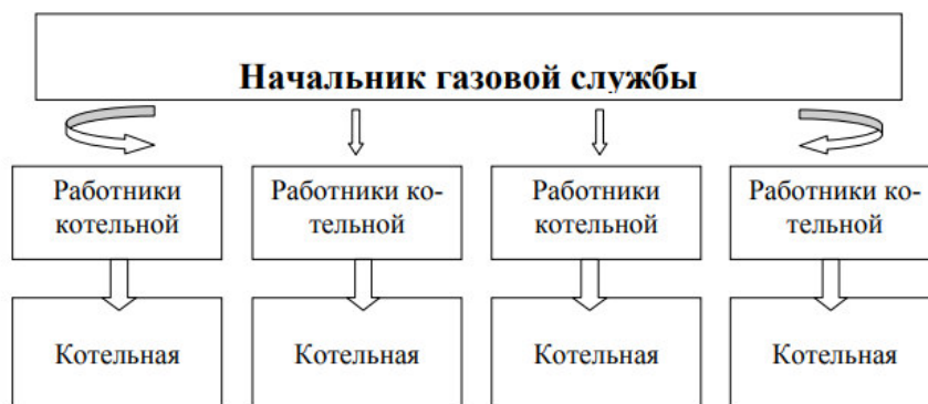
Рисунок 1 – Существующая схема обслуживания котельных

Численность персонала МУП «Теплый дом» – 63 чел. Значительная доля персонала предприятия, работает в территориально расположенных котельных. Общая схема обслуживания котельных представлена на рисунке 1.