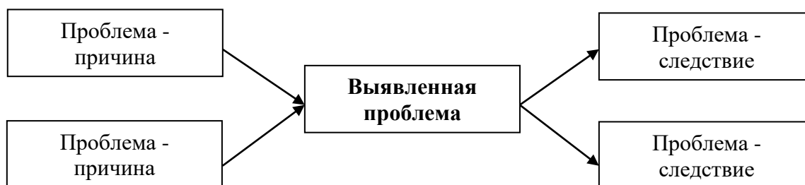
Рис. 1. Схема причинно-следственного анализа [5]

Пример оформления представлен на рисунке 1. Иное оформление рисунков не допускается.